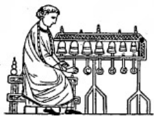
Carillon (XIII e s.).