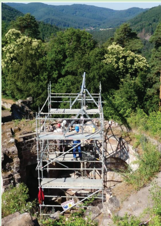
Construction de la voûte avec Dambach à l'horizon