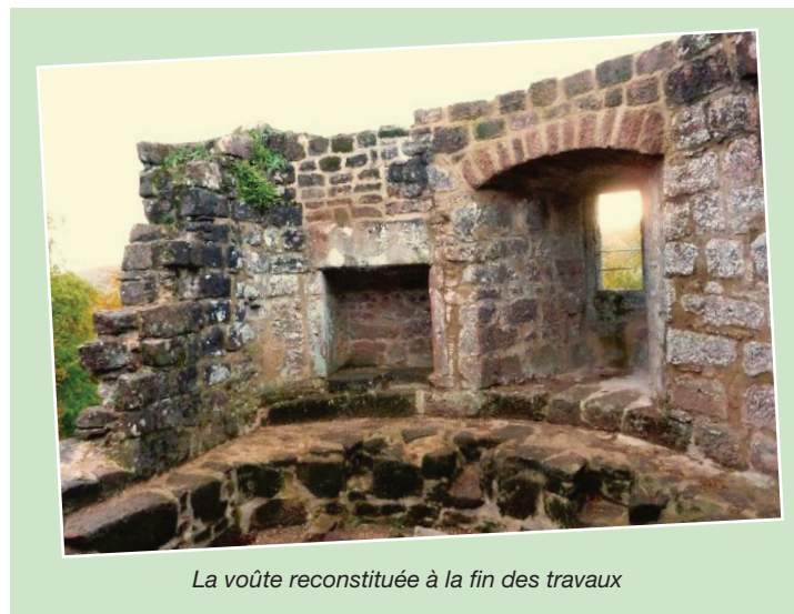
La voûte reconstruite à la fin des travaux

En 2023, notre association a poursuivi son œuvre commencée en 2000 pour la sauvegarde du Schoeneck. Au centre du site, la voûte d'une fenêtre de la grosse tour d'artillerie (XVI ème siècle) a été construite grâce à l'ingéniosité, la persévérance, le savoir et l'enthousiasme de nos bénévoles. Un mur qui menaçait de s'écrouler dans la cave nord-est a été déposé puis remonté. Dans le même secteur, les extrémités du mur bouclier situées entre la tour octogonale et la rocher nord ont été stabilisées et jointoyées. Enfin, la fosse d'entrée du château a été curée et rejointée. Notez aussi qu'à l'initiative du Comité Départemental du Tourisme Equestre du Bas-Rhin et avec l'accord du propriétaire, une table de pique-nique complète les barres d'attache à chevaux installées en 2022. Ce lieu accueillant offre un beau point de vue sur la ruine. N'hésitez pas à nous rendre visite tout au long de l'année, nous sommes toujours ravis de partager notre passion. Depuis votre village, c'est une balade agréable à pied d'un peu moins de 4 Km pour y parvenir. Outre l'architecture, découvrez