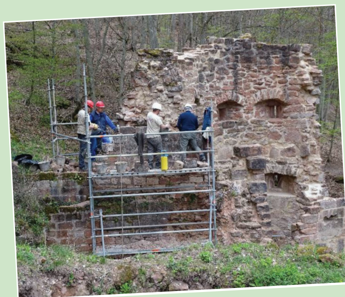
Travaux sur le mur bouclier nord