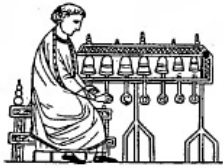
Carillon (XIII e s.).