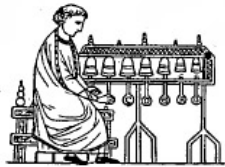
Carillon (XIII e s.).