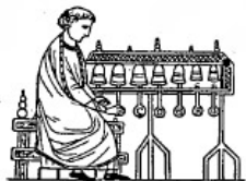
Carillon (XIII e s.).